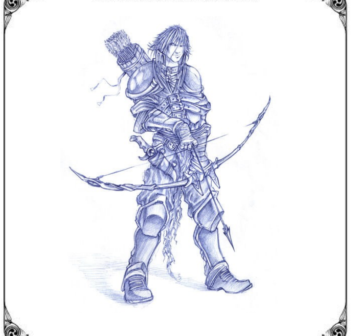
ILLUSTRATION DE PERSONNAGE

Natif des environs du Bois des Feuilles, en Pristinia