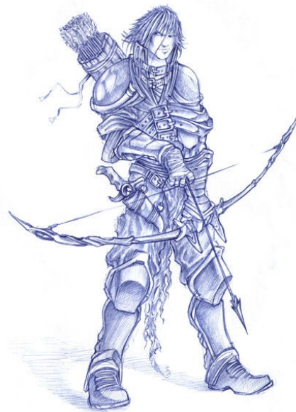
ILLUSTRATION DE PERSONNAGE